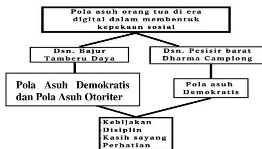
Gambar 1. Komparasi pola asuh orang tua di Dusun Pesisir Barat dan Dusun Bajur Tamberu Daya

memberikan manfaat, sehingga akan tercipta pengasuhan orang tua yang menyenangkan dan tidak membangkang maupun dibangkang.