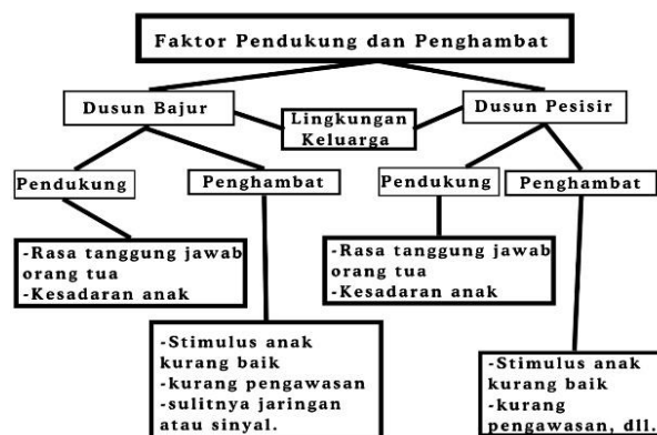
Gambar 3. Faktor Pendukung dan Penghambat

Sedangkan faktor penghambat pola asuh orang tua di era digital ini adalah kesulitan orang tua dalam peneguran, pemberian nasehat dan pengawasan intens, karena anak terlalu fokus dengan suara dan gambar yang mereka tonton, dari pada suara yang terucap dari lisan orang tua mereka. Sehingga kepekaan mereka sangat berkurang dalam merespon stimulus yang orang tua berikan (kecanduan gadget). Ditambah hal yang menghambat di Dusun Bajur yaitu kesulitan mengakses media digital untuk menjadi online, karena letak geografisnya di daerah pegunungan sehingga menyebabkan sulitnya tersambung jaringan data/internet.